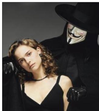
V pour Vendetta, un film complexe, à revoir. DOC. REMIS